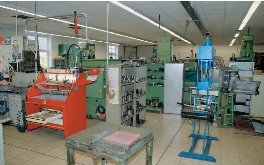
Reichlich Technik: Motoreninstandsetzungsbetriebe wie Huber & Wiessner verfügen über alle Maschinen und Werkzeuge, um damit Motoren sämtlicher Bauarten, vom Pkw (auch Oldtimer) bis zum Nutzfahrzeug, instandsetzen zu können.

Im Verband der Motoreninstandsetzer sind derzeit etwa 130 Betriebe organisiert, die den Kfz-Werkstätten ihre Dienste anbieten. Die Spezialisten stehen für hohe Leistungsstandards und garantieren eine Wiederherstellung der ursprünglichen Motorleistung und Lebensdauer. Gerade in Zeiten, wo viele Kunden sparen wollen, lohnt es sich für die Werkstätten, über dieses Angebot nachzudenken. Thomas Mareis