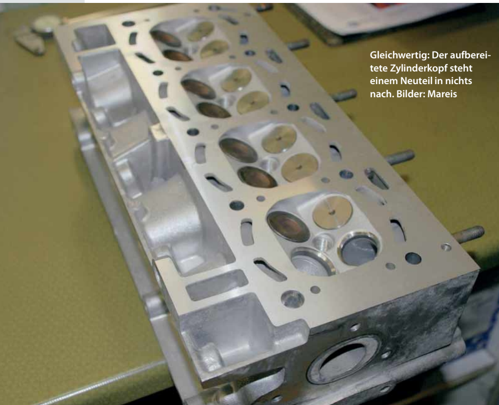
Gleichwertig: Der aufbereitete Zylinderkopf steht einem Neuteil in nichts nach.

Ein ‚vergessener‘ Zahnriemenwechsel reicht, und schon ist es passiert: Der Motor ist ‚Schrott‘. Doch die Werkstatt muss nicht immer gleich zu einem teuren Tauschmotor oder neuen Zylinderkopf greifen. KRAFTHAND hat sich bei dem Motoreninstandsetzer Huber & Wiessner in Augsburg über die Alternativen informiert.