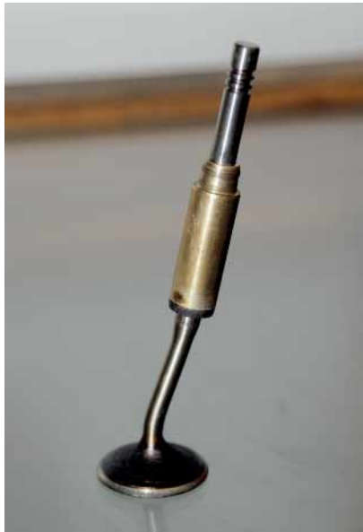
Rissopfer: Ein typisches Schadensbild für einen gerissenen Zahnriemen ist dieses verbogene Ventil. Der Rumpfmotor trug dabei keinerlei Schaden davon, weshalb die Instandsetzungskosten dank Zylinderkopf-reparatur moderat blieben.

Anschließend stellt der Motorenfachmann den Ausdrehradius so ein, dass nur ein dünner Rand des Rings stehen bleibt. Das Ausdrehen erfolgt nach Gehör: Dass der Sitzring komplett ausgedreht ist, erkennt der Profi am leiser werdenden Geräusch. Zum Schluss lässt sich der verbleibende Steg leicht mit einem Schraubendreher aus dem Zylinderkopf entfernen. Jetzt