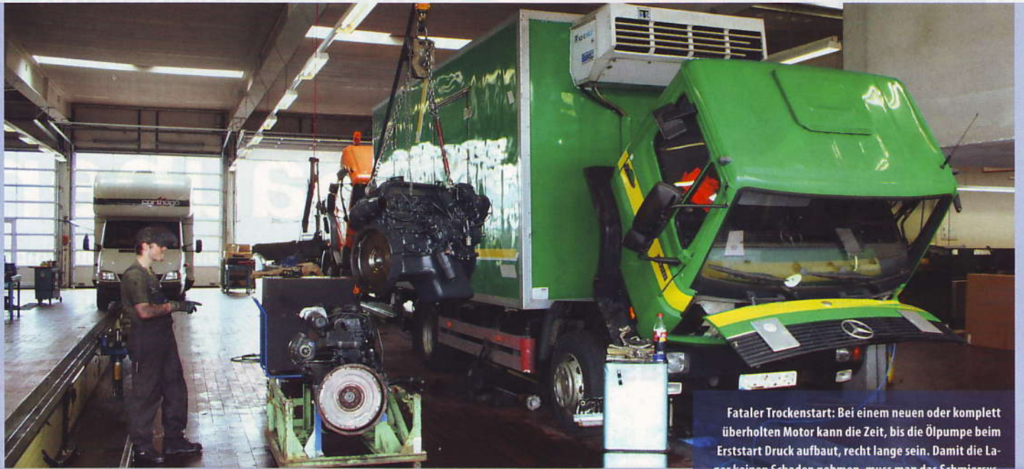
Fataler Trockenstart: Bei einem neuen oder komplett überholten Motor kann die Zeit, bis die Ölpumpe beim Erststart Druck aufbaut, recht lange sein. Damit die Lager keinen Schaden nehmen, muss man das Schmier-system manuell mit Öl befüllen.