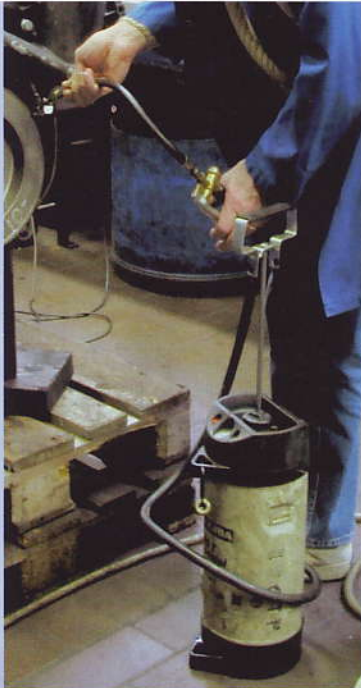
Druckvoll füllen: Rund 30 Prozent der vorgeschriebenen Ölfüllmenge werden beim „Aufdrücken“ über einen Schraubanschluss in den Schmierkreislauf gedrückt.